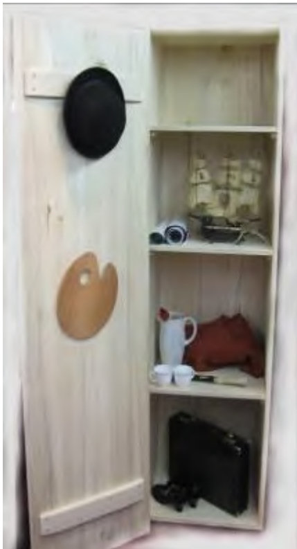
Als Schrank, stehend