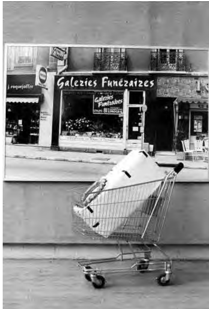
"Galeries funéraires" ( Bestattungsgalerie) Salon Grands et Jeunes, Paris France

- Nearly 600 exhibitions, including over 90 solo shows, line his way through Europe, America and Asia.