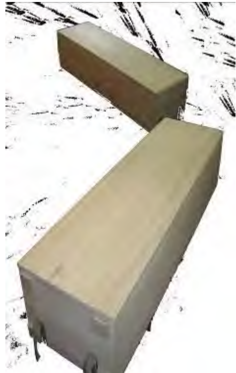
Als Truhen liegend