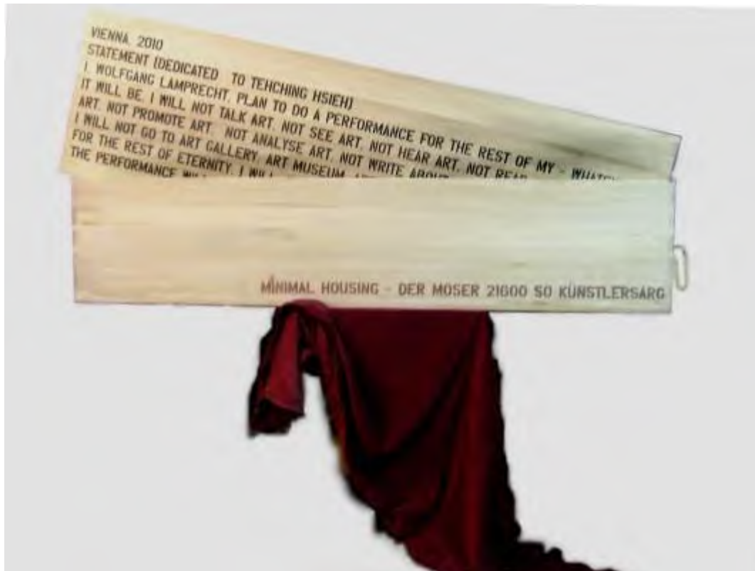
„Sound of Silence“