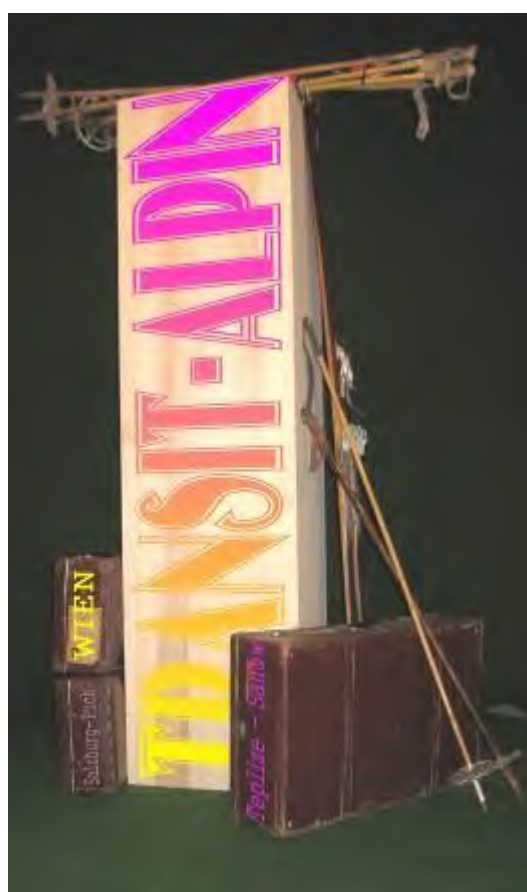
FLUCHTKISTE : „TRANSIT-ALPIN“

Botschafterin der Republik KUGELMUGEL, Fluxus-Künstlerin, Komponistin, Bandleaderin (JONESMOBILE), Jazzsängerin.