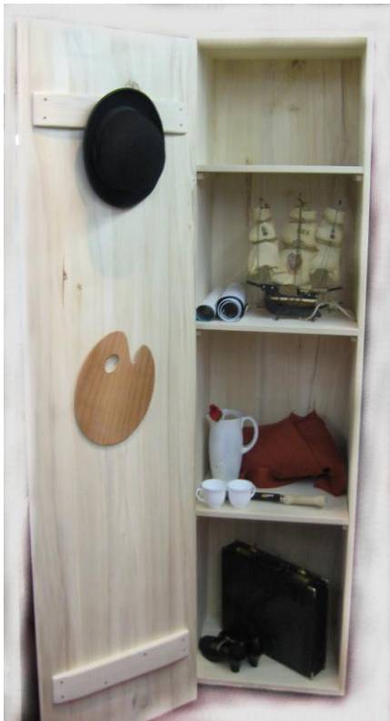
Als Schrank, stehend