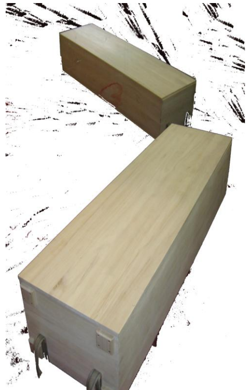
Als Truhen liegend