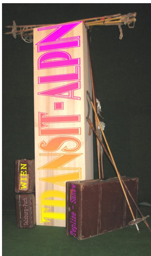
FLUCHTKISTE : „TRANSIT-ALPIN“

Botschafterin der Republik KUGELMUGEL, Fluxus-Künstlerin, Komponistin, Bandleaderin (JONESMOBILE), Jazzsängerin.