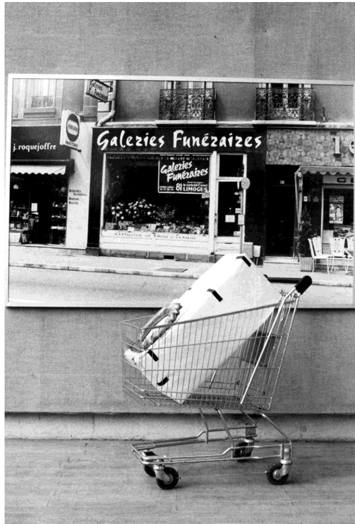
"Galeries funéraires" ( Bestattungsgalerie) Salon Grands et Jeunes, Paris France

- Nearly 600 exhibitions, including over 90 solo shows, line his way through Europe, America and Asia.